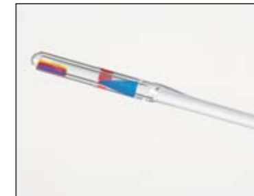
Faszinierende Technik - Faserspitze der Laserfaser

durchgeführt. Die GreenLight HPS Lasertherapie ist ein modernes, unblutiges, minimal-invasives Verfahren zur Behandlung der BPH. Das Verfahren verwendet Laserenergie zur Entfernung von vergrößertem Prostatagewebe. Bei dem Eingriff wird eine Laserfaser mittels eines endoskopischen Systems durch die Harnröhre an das Prostatagewebe gebracht. Dort wird die Laserener-